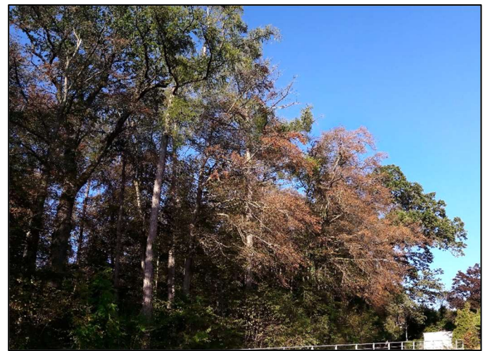
Feuillage roussi par la sécheresse sur de vieux hêtres

Nous constatons déjà le dépérissement de certaines espèces en plaine, notamment le hêtre, l'épicéa mais aussi le sapin blanc. Le dernier automne très pluvieux permettra à la forêt de reprendre ce printemps dans de bonnes conditions hydriques, les nappes phréatiques étant pleines. Malgré cela, il n'est pas sûr que tous les arbres ayant souffert du manque d'eau en 2023 « se réveilleront » ce printemps, notamment les hêtres majestueux.